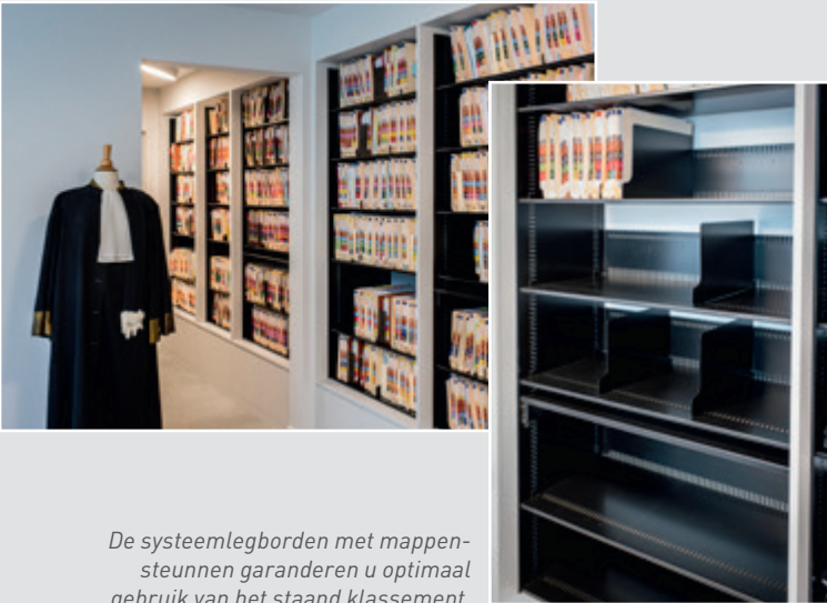
De systeemlegborden met mappensteunen garanderen u optimaal gebruik van het staand klassemment.

Ariës systemen zijn perfect te integreren in maatwerk kasten. Zodoende combineert u de mogelijkheden van maatwerk met de veel efficiëntere kastinrichtingen met stalen inbouwelementen.